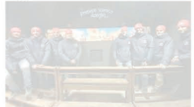
I realizzatori del progetto nato nel 2007