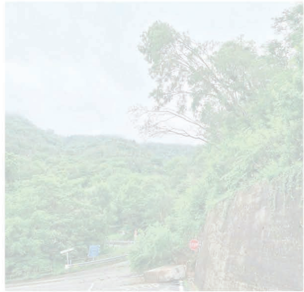
L'immagine eloquente degli alberi inclinati all'altezza del punto in cui si sarebbe dovuti intervenire a giorni