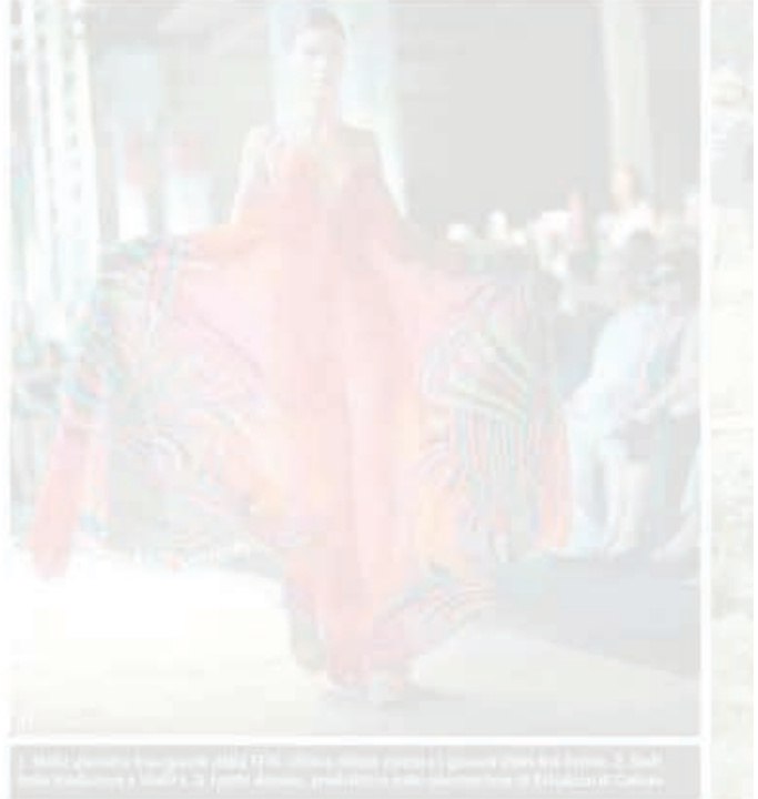
Modello durante la sfilata della "Torino Fashion Week".

Il festival "Torino Fashion Week" è un evento che si svolgerà dal 27 giugno al 31 luglio a Torino. L'evento è organizzato da un gruppo di esperti e blogger dal mondo, che si incontreranno per discutere di moda e cultura. Il festival è un'occasione unica per scoprire le ultime tendenze del mondo della moda, e per incontrare esperti e blogger dal mondo.