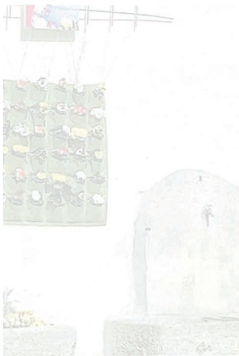
5 davanti alla fontana della chiesa