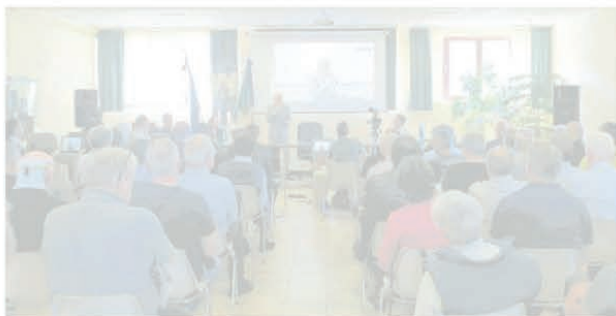
La giornata ha visto una forte partecipazione di sindaci e associazioni

Il progetto vede come capofila i Comuni di Vidracco e Montalenghe e il contributo della Regione Piemonte e coinvolge 86 Comuni del Canavese, del versante della Serra del Biellese, il Vercellese coinvolgendo i principali centri di Cuornè, Rivarolo, Castellamonte e Ivrea. Un progetto preliminare realiz-