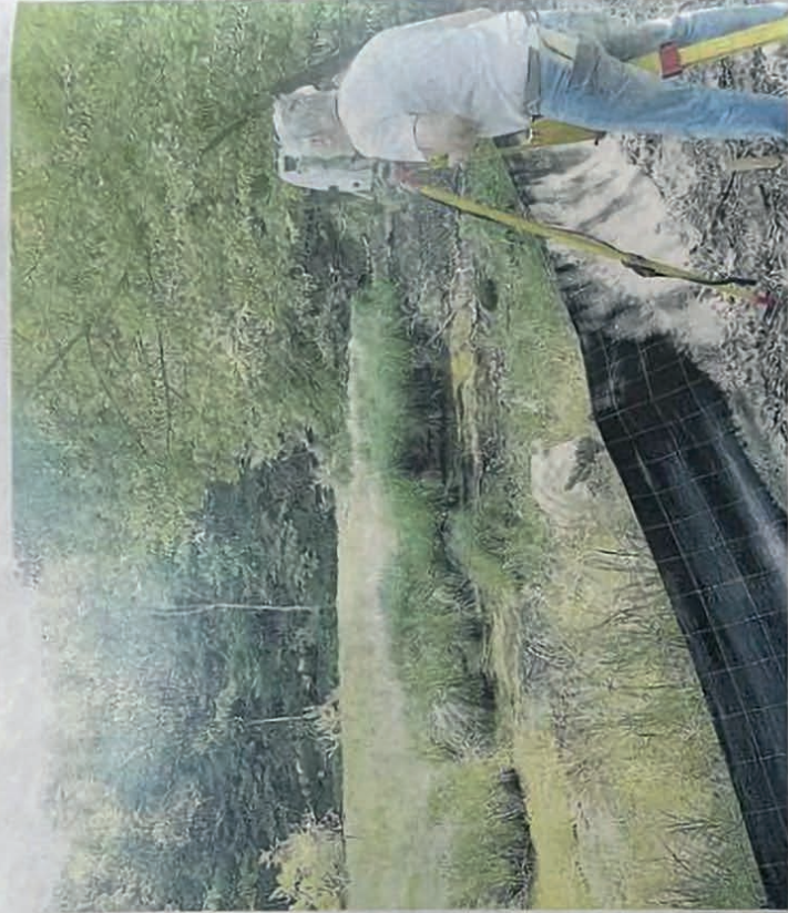
MERCOLEDÌ 5 APRILE 2023 LA SENTINELLA

I ricercatori monitorano a Pianezze la presenza del rospetto Pelobates fuscus insubricus