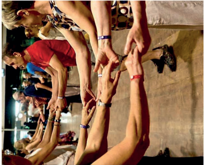
L'edizione 2024 ha totalizzato ottomila presenze