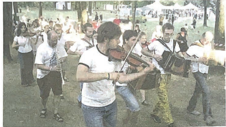
Musicisti in un'immagine d'archivio del Gran Bal Trad