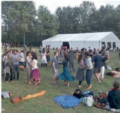
La scorsa edizione

La seconda novità riguarda lo spostamento dell'area campeggio che ospita tra le 500 e le 600 tende al fine di limitare al massimo l'accesso dei mezzi nei pressi dell'a-