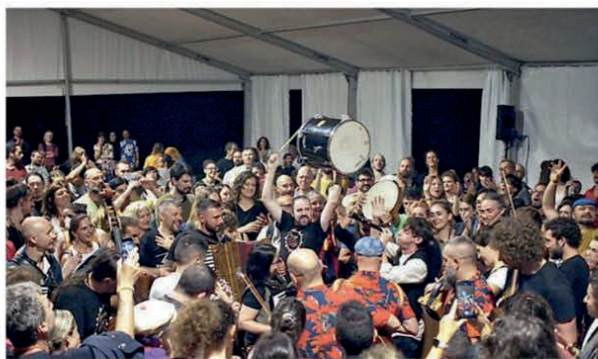
L'atmosfera festosa del Gran Bal Trad