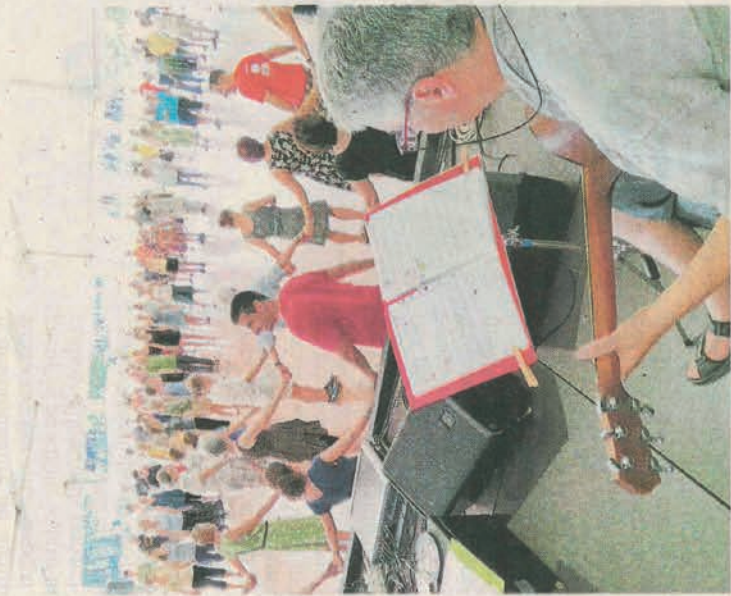
Ventesima edizione da incorniciare per il Gran Bal Trad

lia - dalla Sardegna alla Puglia, dalle Marche all'Emilia Romagna, dal Veneto alla Lombardia -, e poi da Irlanda, Spagna, Nord Europa, Francia, il Gran Bal Trad ha offerto alle migliaia di appassionati anche la migliore produzione artigianale di strumenti musicali, in gran parte utilizzati proprio per le