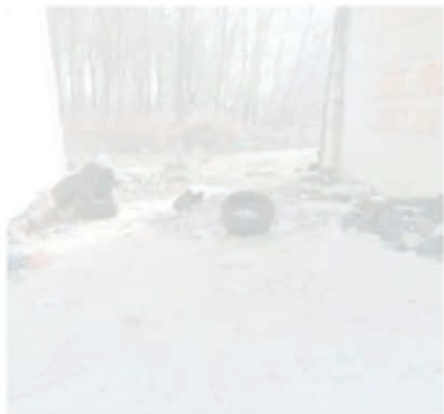
Maggiori controlli soprattutto a Carone