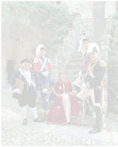
I personaggi dell'edizione 2024

Si era verificata la stessa situazione nel 2022, quando a risolvere l'impasse era intervenuto l'esecutivo del sindaco Renzo Galletto. Che ora si è rimesso in moto con il medesimo obiettivo, lanciando un appello al paese. Il primo cittadino, infatti, è allibito: «Mi interrogo sulla mancanza di volontà nell'organizzazione di un evento per il quale esistono le condizioni migliori: il comitato ha una sede, in cassa ci sono i soldi, il Comune offre