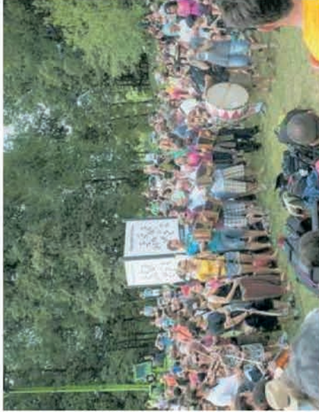
Balli e musiche tradizionali a Pianezze

Una scelta in parte dovuta alle prescrizioni metropolitane, ma in gran parte scelti dagli stessi promotori del Gbt, da sempre impegnati a contestualizzare, dal punto