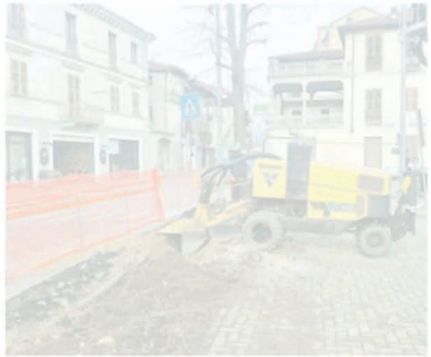
Lavori in corso in piazza Germanetti a Borgofranco