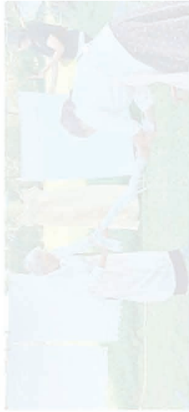
Una delle attività proposte